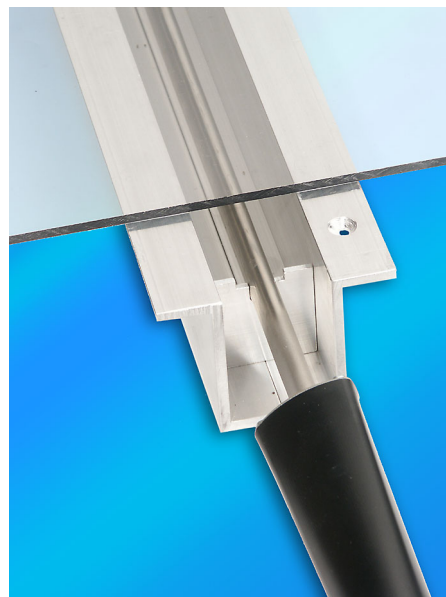
Heizstab hochkant - schmale Erwärmung