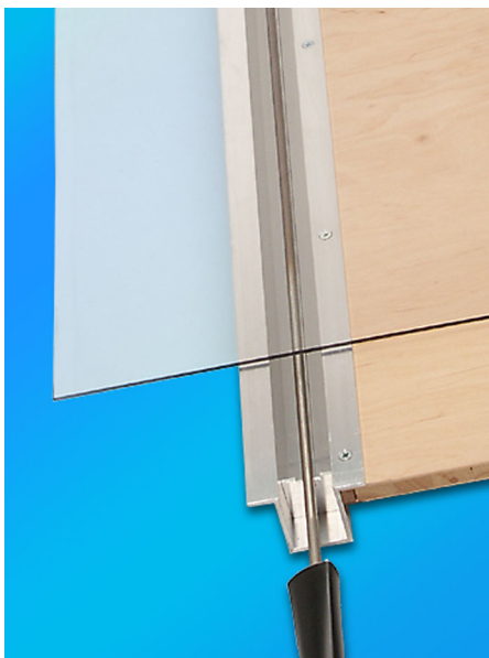
...oder seitlich angeschraubt