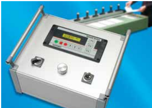
2 Zeiten eingeben

Die Zeiten werden in das Bedienfeld eingegeben: Erwärmen 50 sec, Handhabung 10 sec. Der Rechner nennt 6 Nutzenpositionen. Die Signalleuchten werden entsprechend der Größe der Zuschnitte in der Stromschiene positioniert. Start.