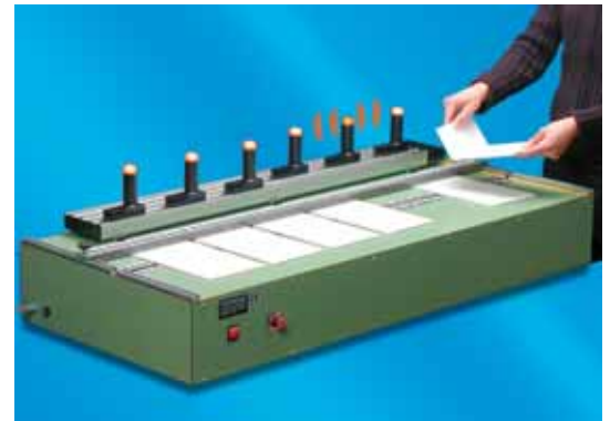
Ein fertig erwärmter Zuschnitt wird signalisiert und abgenommen