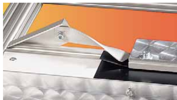
Stabilisierungseinheit, Biegeradius und Vorspannung werden eingefroren

Die Gerätereihe FAG-FS wird in folgenden Varianten gebaut: